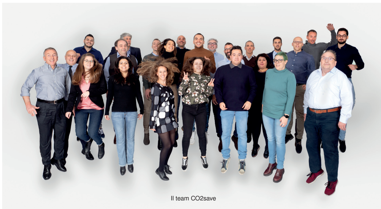
Il team CO2save

In settori come la GDO food, GDO retail, hotelierie e hospitality il tema della sostenibilità è già da tempo un asset strategico nello sviluppo del business, spesso in risposta alle richieste dei consumatori che preferiscono scegliere aziende sostenibili.